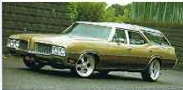
「旧車市場で人気の高いVista Cruiser。このモデルは、1970年代後半に登場した。乗用車のボディを延長して、荷物を積むためのスペースを確保したのが特徴。乗用車とほぼ同じデザインで、乗用車の延長線上に荷室が追加されたというイメージが強い。」

「乗用車のボディを延長して、荷物を積むためのスペースを確保したのが特徴。乗用車とほぼ同じデザインで、乗用車の延長線上に荷室が追加されたというイメージが強い。」