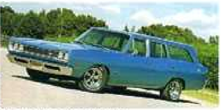
「乗用車のボディを延長して、荷物を積むためのスペースを確保したのが特徴。乗用車とほぼ同じデザインで、乗用車の延長線上に荷室が追加されたというイメージが強い。」